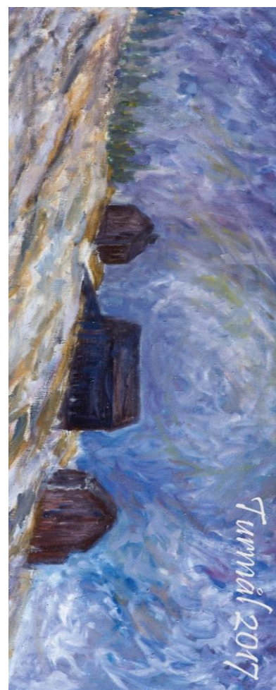
Motiv på turmålkopp 2017, utsnitt av maleriet «Fjellgard» av Dag Gimle